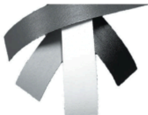
WGRZEWANIE TAŚMY PVC