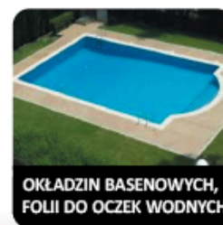
OKŁADZIN BASENOWYCH, FOLII DO OCZEK WODNYCH