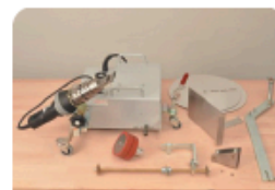
ZESTAWY DO ZGRZEWA NIA TAŚMY ANTYWŁAMANIOWEJ