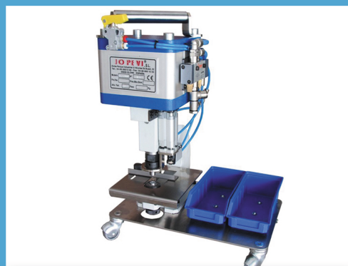
MODEL J-42 CARRO ZAKUWARKA PNEUMATYCZNA