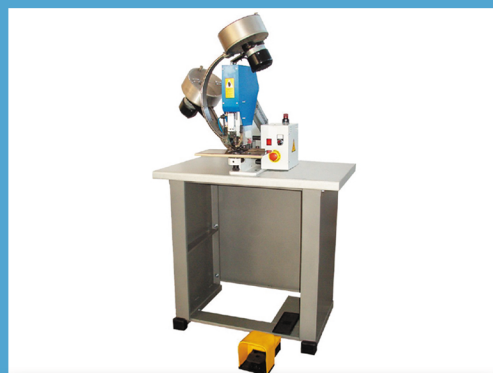
MODEL J-279 ZAKUWARKA PNEUMATYCZNO-ELEKTRYCZNA