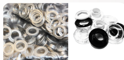
OCZKA DO ZAKUWANIA MANUALNEGO