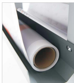
Przednia rynna do wydruków