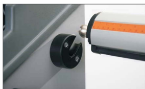
Trzy aluminiowe walki z automatycznym systemem blokującym