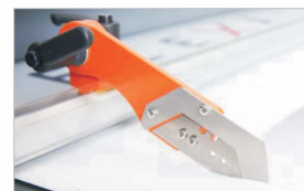
Stół tylny z nożem tnącym (opcjonalnie)