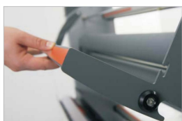
Podnoszony stalowy stolik, ułatwiający dostęp do walków