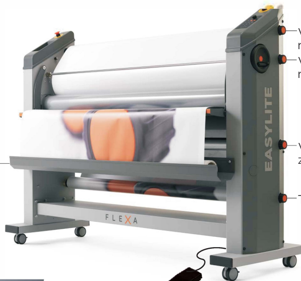
Watek nawijający z regulacją naprężenia