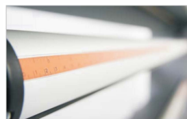
Miarka na każdym walku ułatwiająca właściwe pozycjonowanie materiałów